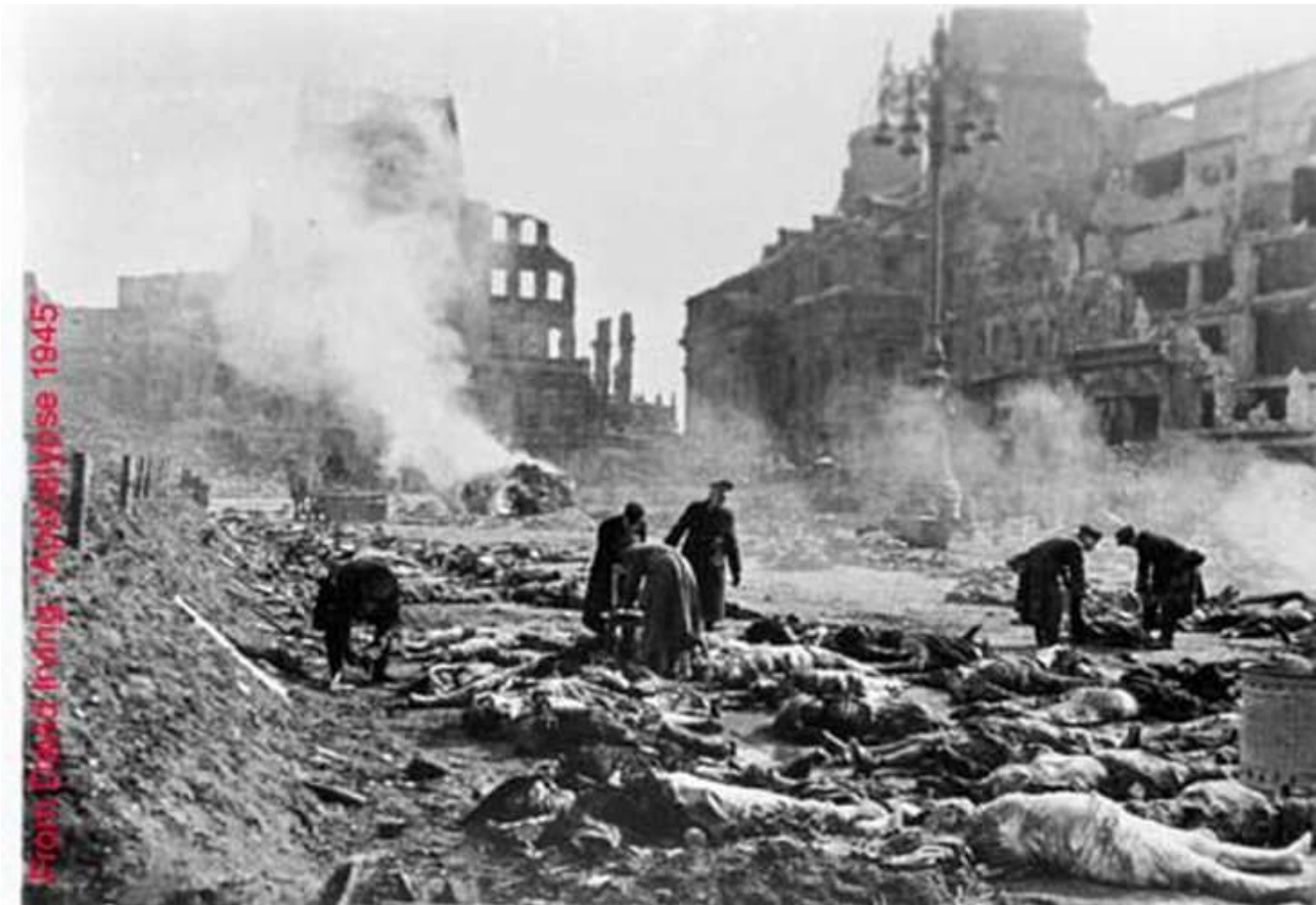
Sabato 15 febbraio 1945: si tenta di ricomporre le salme

Quante persone sono state assassinate a Dresda? I libri –ufficiali- di storia sparano cifre ridicole; ma e' anche vero che sul numero dei sopravvissuti e' stata calata una cappa di silenzio proprio per celare la vera entita' dello sterminio: se si sa quante persone sopravvissero, per contrasto si arriva a capire quante morirono realmente. Ma chi vi scrive attinge ad Autori che non hanno paura di parlare e i dati da questi scovati in anni di studio sono raccapriccianti: 250.000 almeno, 300.000 al massimo. Chi sostiene cifre come 80.000, 100.000 e giu'di li merita solo di essere mandato a quel servizio.