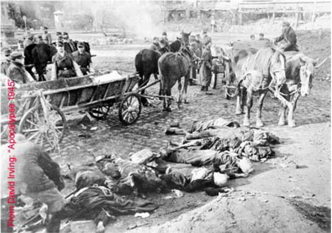
In Sassonia settentrionale gli unici mezzi di locomozione sono ormai i carretti ippotrainati

L'opera di ricomposizione delle salme e' straziante e difficile; inoltre agli ultimi soccorritori si presenta uno strano fenomeno: anche se si suppone che sotto le macerie ci siano i corpi (ancora da estrarre) di migliaia di morti, Dresda sembra presentare un numero assai minore di abitanti (compresi gli sfollati dalle altre citta'). Alla fine si incomincia a capire che un enorme numero di persone e' andato letteralmente liquefatto (o evaporato) durante l'impazzire del Firestorm . Per un paio giorni dopo lo sterminio, pezzi di esseri umani piombano al suolo anche in luoghi distanti dalla citta'. Misurando in kilotoni la totalita' dell'energia cinetica erogata nei tre attacchi, la forza distruttiva fu superiore a quella della bomba atomica sganciata su Hiroshima, ovviamente, non essendo stato usato uranio non vi fu ricaduta di elementi radioattivi... ci fu "solo" una ricaduta di numerose parti anatomiche umane.