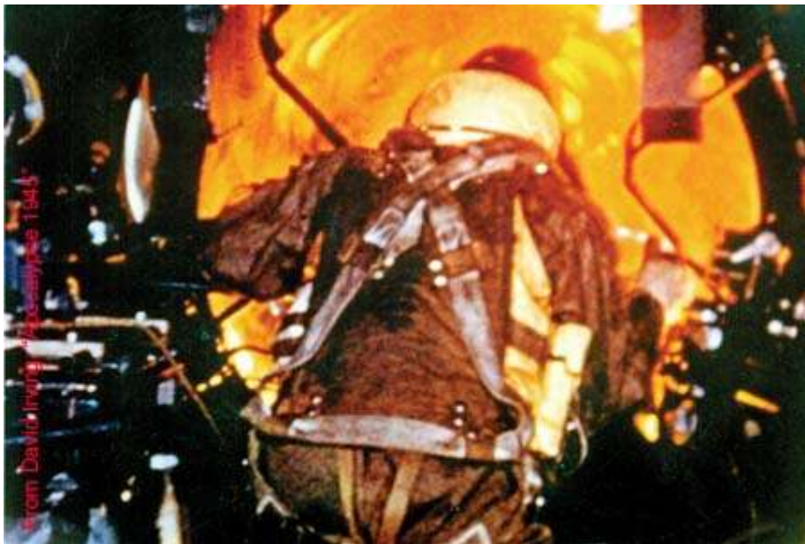
Oltre il plexiglass sferico che protegge il mitragliere si vede il Firestorm sottostante

Dopo circa un'ora il mostro perde di intensita' e le colonne di soccorso iniziano a muoversi: tutti i reparti di vigili del fuoco e di poliziotti ancora provvisti di automezzi si dirigono verso i resti di Dresda; gruppi di semplici volontari e della milizia territoriale (in massima parte formati da vecchi e da ragazzini) si mettono in