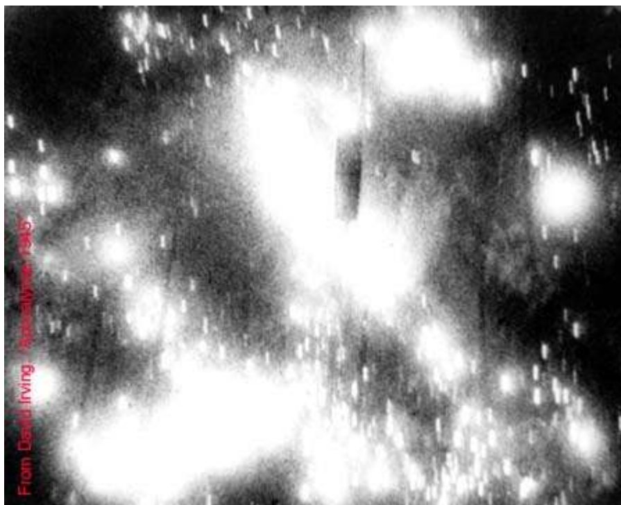
In primo piano una bomba sta cadendo, oltre si vede il dilagare degli incendi