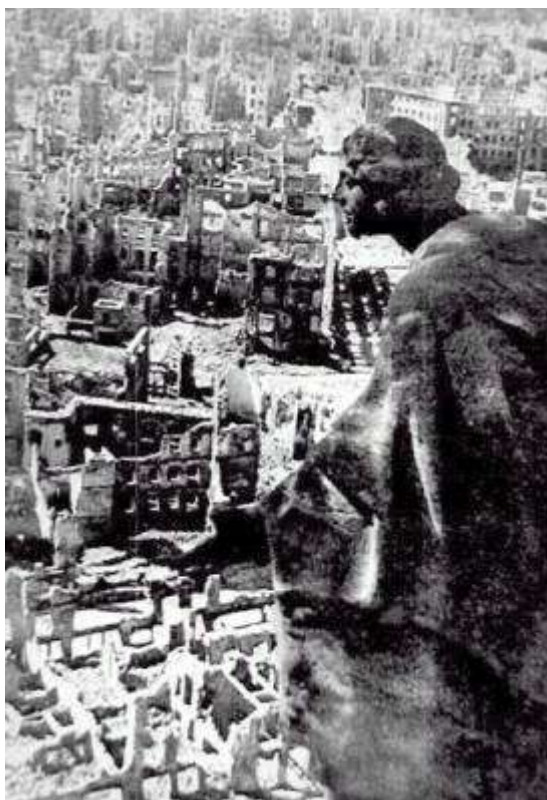
Una statua rimasta quasi intatta su una guglia della cattedrale di Dresda