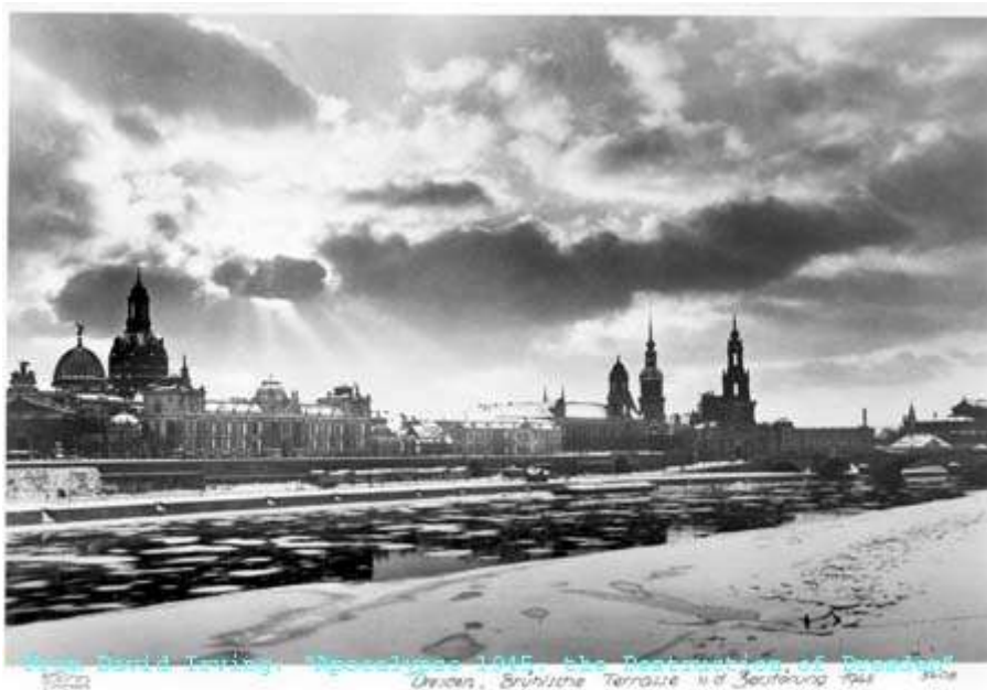
Dresda sulle sponde dell'Elba, poco prima dell'attacco