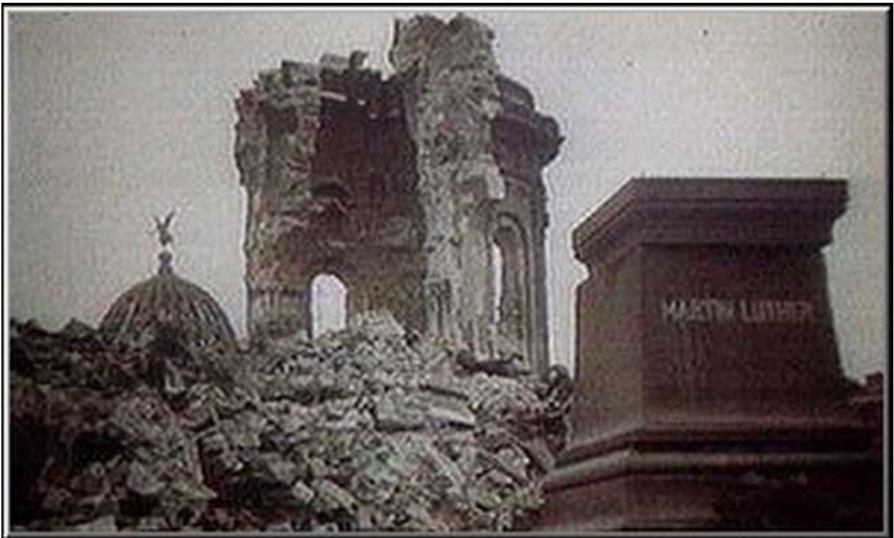
Il cippo intatto, di granito, commemorativo di Martin Lutero

Esattamente come previsto dai mandanti, tre ore dopo la prima, una seconda ondata di assassini si getta sulle macerie: un'altra intera armata aerea britannica AGGREDISCE gli scampati ed i gruppi di soccorso. Questa volta il sadismo si esplica in modo differente: un gruppo concentra il bombardamento sul centro della città per portare nuovo alimento all'incendio che si sta ritirando su se' stesso, mentre un altro spazza il perimetro periferico ed il vicino hinterland per distruggere le nuove colonne di soccorso. E' la solita vecchia strategia empirica; quando i pescatori tolgono i pesci dalle reti, decine di vespe si materializzano per trovare cibo, allora si mette un grosso pesce in disparte per attirarle, poi, quando ne è ben coperto si dà una bella ciabattata per schiacciarle tutte: questo fu il premeditato pluriomicidio architettato ai danni dei soccorritori. Eppure i capi delle democrazie occidentali erano i propugnatori della Convenzione di Ginevra, i difensori del diritto internazionale... che stramaledetto schifo!